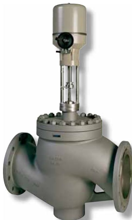
M300 BR240S M300Y BR240S